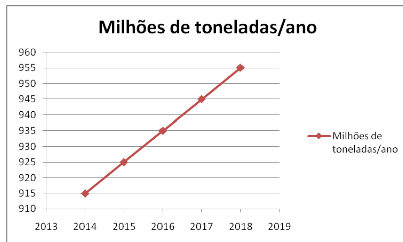
Figura 2. Média anual de resíduos eletroeletrônicos no Brasil (IBGE, 2016)

Segundo a Diretiva 2002/95/CE (PARLAMENTO EUROPEU, 2003) são definidas dez categorias para os equipamentos eletroeletrônicos (EEE) que vão desde os pequenos eletrodomésticos até os distribuidores automáticos. Como as categorias de EEE são abrangentes, para esta pesquisa foram adotadas unidades de estudo segundo a Tabela 2. A Figura 2 relaciona os valores dos REEE em milhões de toneladas por ano entre 2014 e 2018 para o Brasil.